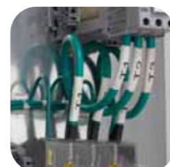
Manchons pour marquage de fils