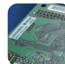
Identification de produits