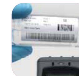
Identification laboratoire et santé