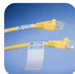
Identification de fils et de câbles