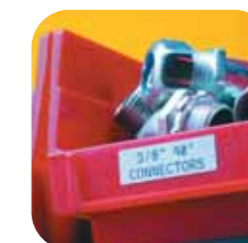
Étiquette de racks