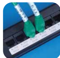
Baies de connexion