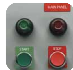
Bouton de commande