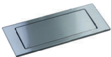
Acier : brossé