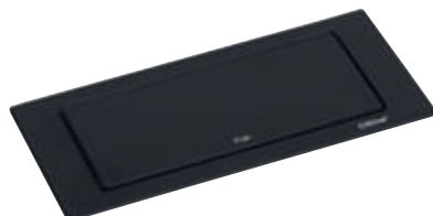
Acier : noir laqué