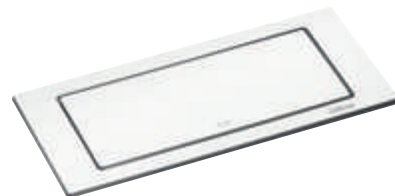
Acier : blanc laqué