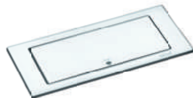
Verre : blanc mat