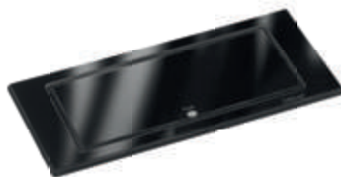
Verre : noir brillant