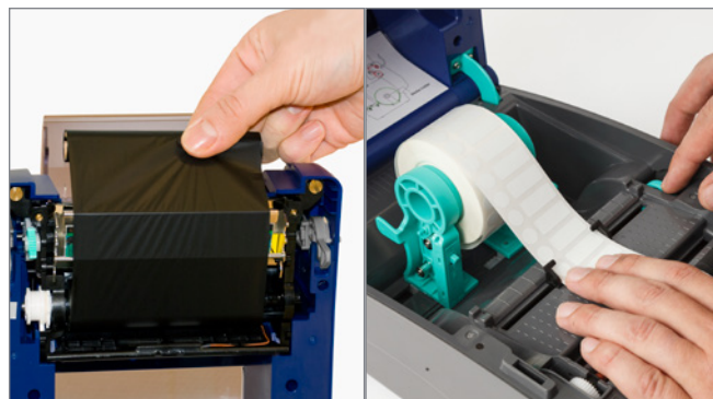
Etape 1 : Insérez le rouleau d'étiquettes