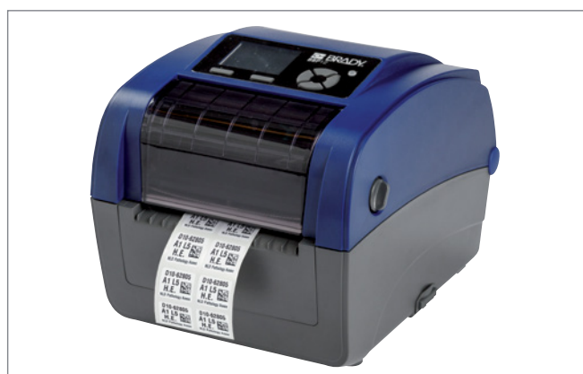
Etape 3 : Imprimez