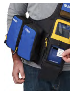
Sac de transport rigide