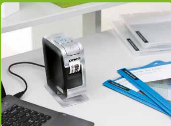
Prête à l'emploi sur le bureau

Aucun logiciel à installer avec la fonctionnalité prête à l'emploi