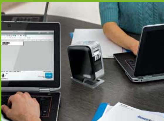
Imprimante sans fil à partager